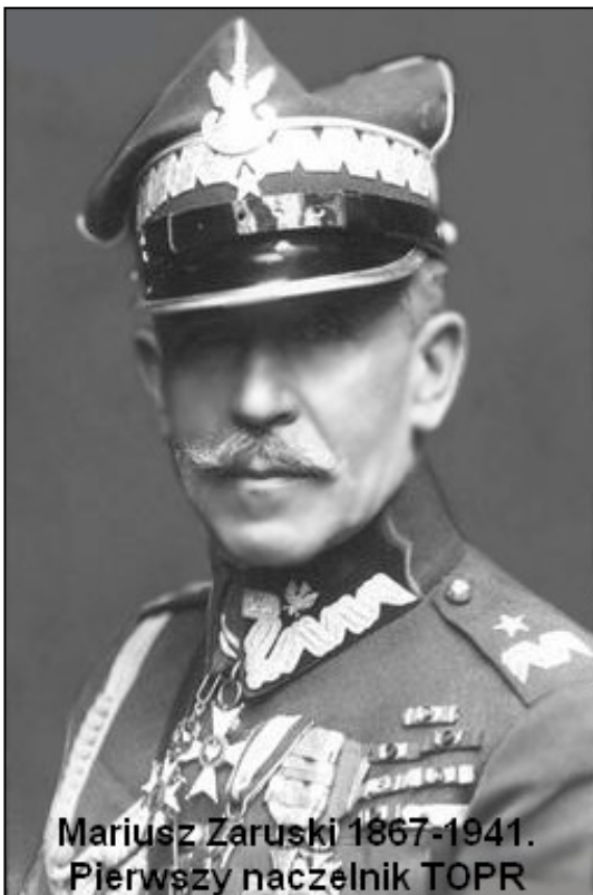
Mariusz Zaruski 1867-1941. Pierwszy naczelnik TOPR