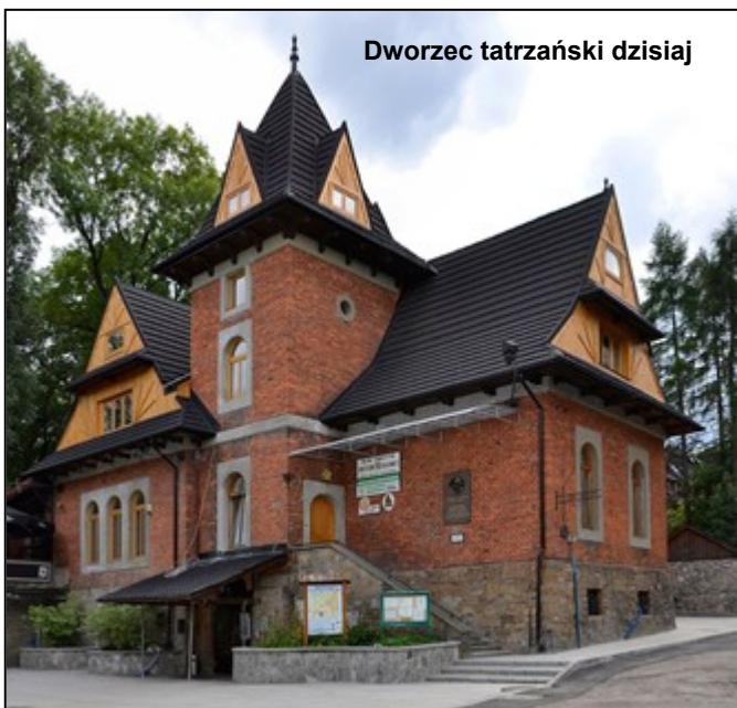
Dworzec tatrzański dzisiaj

Ta przyjęła nazwę Freiwillige Tatra Bergwacht i do końca okupacji przeprowadziła 55 akcji ratunkowych. Jedna z